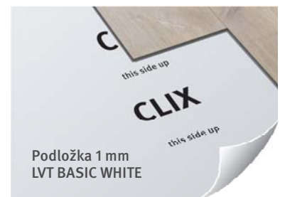
Podložka 1 mm LVT BASIC WHITE