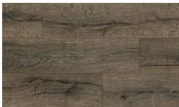
40155 Dub Kingstone hnědý