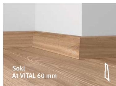
Sokl A1 VITAL 60 mm