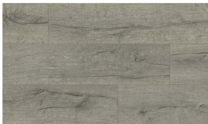
40150 Dub Kingstone hnědo šedý