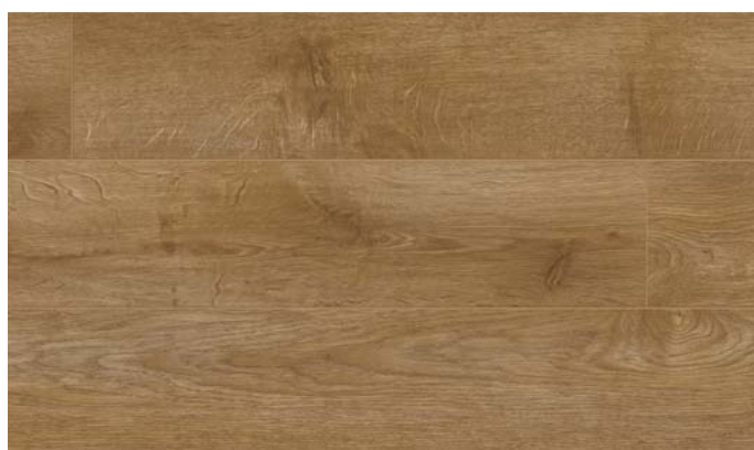
40065 Dub Royal přírodní rustik