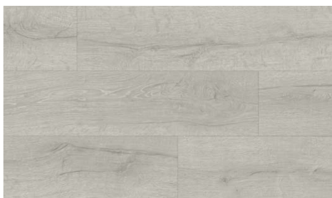
40154 Dub Kingstone světle šedý