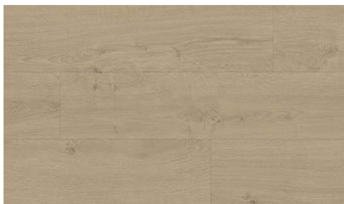
40153 Dub Elegant béžový