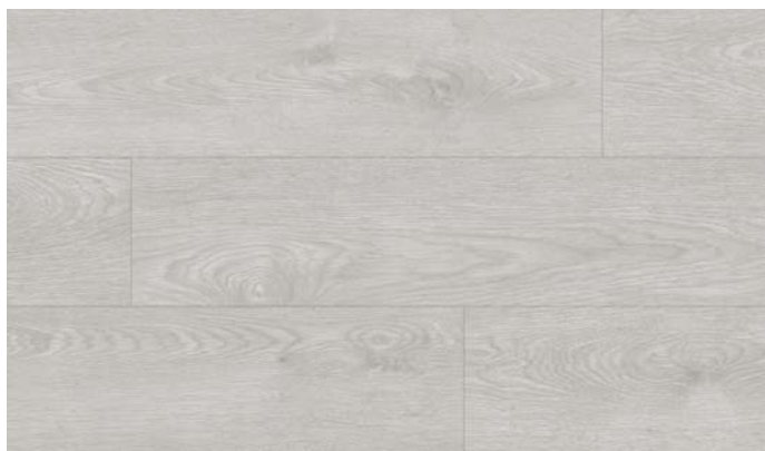
40146 Dub Royal světle šedý