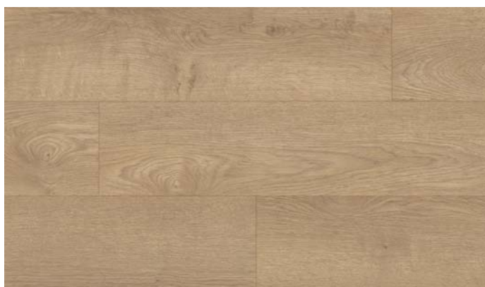
40145 Dub Royal přírodní