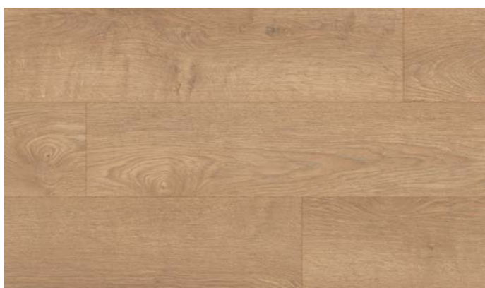
40151 Dub Royal přírodní intenziv