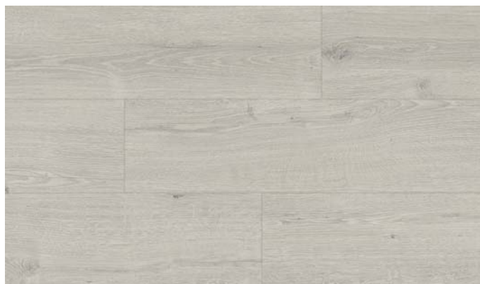
40152 Dub Elegant světle šedý