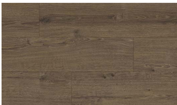
40149 Dub Elegant tmavě hnědý