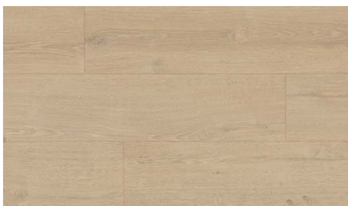
40147 Dub Elegant světlý