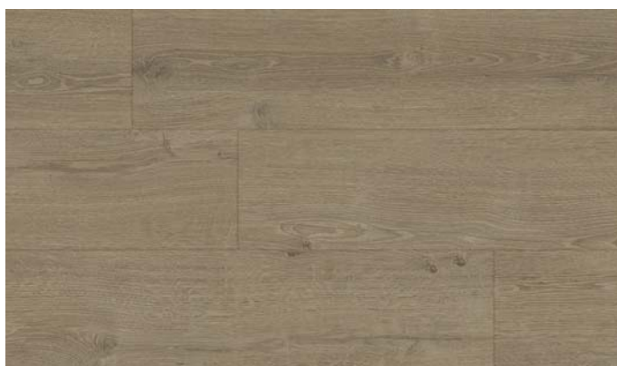
40148 Dub Elegant světle hnědý